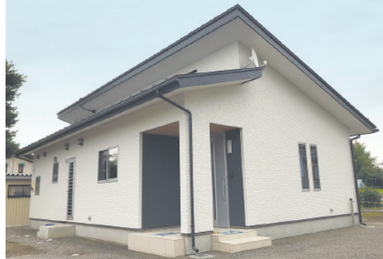
コンパクトでランニングコストを抑えた 心地よい平屋の家