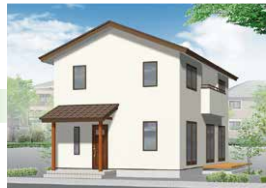
吹き抜けのある塗り壁の家

2棟同時開催 松本市村井町南2丁目 3月23日(土)・24日(日) 10:00~16:00