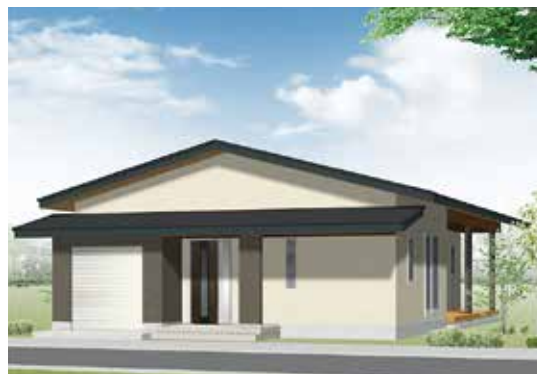
インナーガレージのある タイル貼りの平屋

一階の床下から無垢の床板及び 部屋全体を心地よく暖めるお勧めの 床下冷暖房『エアボレー』を体感できます。 あたたかさや自然素材の それぞれの表情をご体感ください！